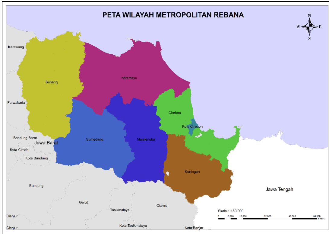
Gambar 3 Peta Administratif Kawasan Metropolitan Rebana