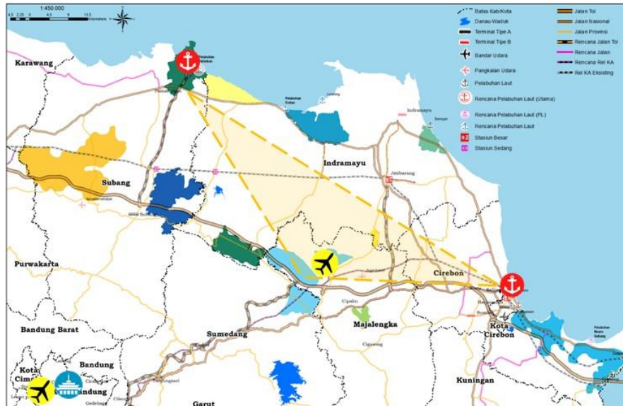
Gambar 2 Peta Segitiga Rebana

Rebana Metropolitan diproyeksikan sebagai motor penggerak pertumbuhan ekonomi Jabar di masa depan melalui pengembangan kawasan industri yang terintegrasi, inovatif, kolaboratif, berdaya saing tinggi, serta berkelanjutan. Wilayah Metropolitan Rebana ini sendiri memiliki badan pengelolanya sendiri yang membuat strategi objektif “ Rebana Libability 5.0 – Penciptaan Kutub Pertumbuhan Kompetitif ”. Terdapat beberapa proyek yang telah dibangun di Kawasan Metropolitan Rebana, proyek ini tersebar di kabupaten/kota dengan detail sebagai berikut: