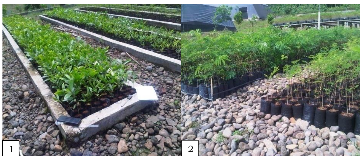
Gambar 2. Contoh uji bibit A. mangium (1), contoh uji bibit F. falcata . (2)

Penilaian terhadap mutu fisik dan fisiologi bibit terdiri dari dua syarat yang harus dipenuhi, yaitu syarat umum dan syarat khusus. Berdasarkan syarat umum yang ditetapkan, semua contoh uji untuk bibit A. mangium memenuhi syarat tersebut. Sedangkan untuk bibit F. falcata terdapat 4 contoh uji yang tidak memenuhi syarat umum. Sembilan belas bibit tersebut tidak memenuhi syarat umum karena jumlah tangkai daunnya kurang dari 6, sedangkan syarat selain itu semuanya terpenuhi. Hasil selengkapnya dapat dilihat pada Tabel 6. Contoh uji bibit A. mangium dan F. falcata di persemaian permanen BPDAS Citarum-Ciliwung disajikan pada Gambar 2.