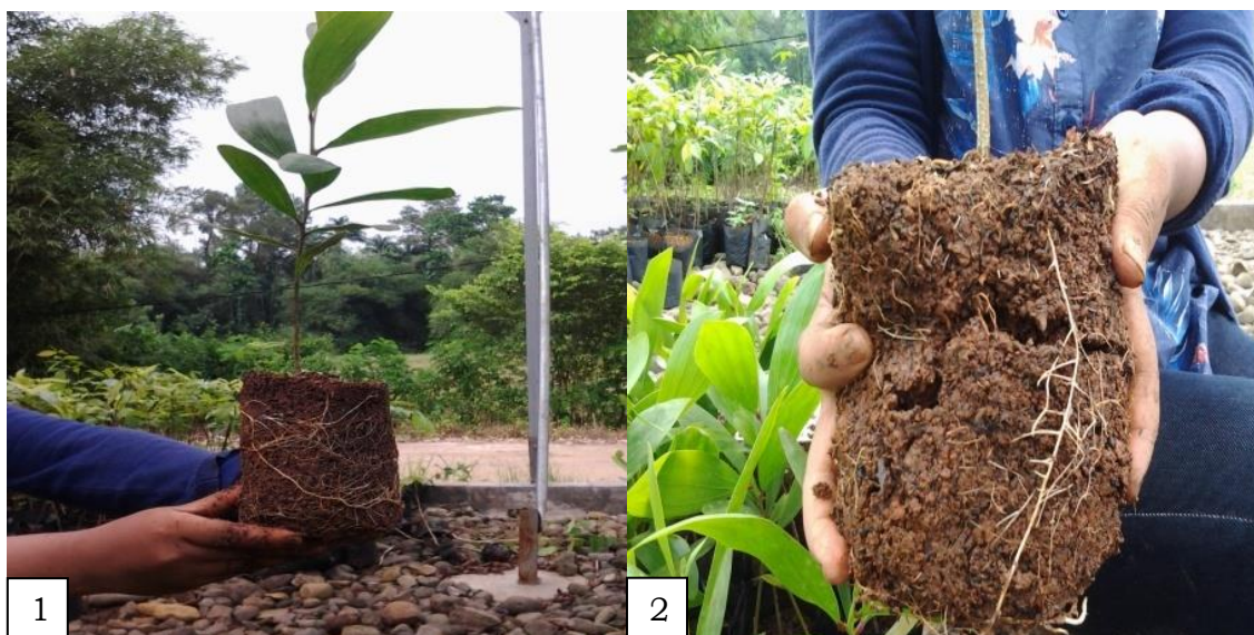
Gambar 3. Media utuh (1), media retak (2)

yang telah dibuka. Kerusakan yang terjadi akibat pengangkatan dapat digunakan untuk menyimpulkan kualitas suatu bibit dan media tanam. Gambar 3 menunjukkan contoh pengujian pada media tanam, media tanam utuh (1) dan media tanam retak (2).