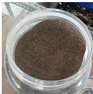
Gambar 1. Tepung Maggot

Adapun inovasi yang dilakukan oleh KUEM melalui pemanfaatan maggot yaitu, dengan memproduksi tepung maggot, dapat dilihat dari gambar dibawah ini: