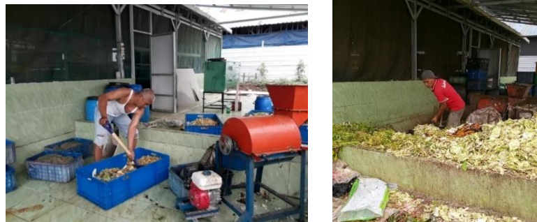
Gambar 1. Kumpulan Sampah Organik dan Aktivitas Proses Pencacahan Sampah Organik di Kandang Maggot Desa Bengle