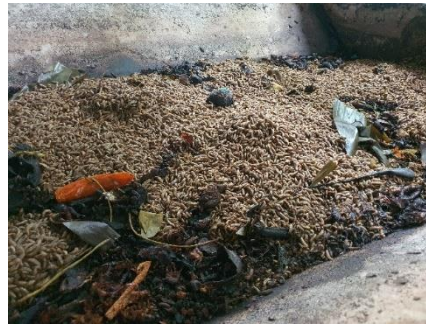
Gambar 3. Sampah Organik diberikan kepada Larva Lalat BSF atau Maggot