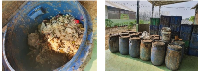
Gambar 2. Sampah Organik Setelah melalui Proses Pencacahan dan dimasukkan ke dalam Tong untuk dilakukan Fermentasi