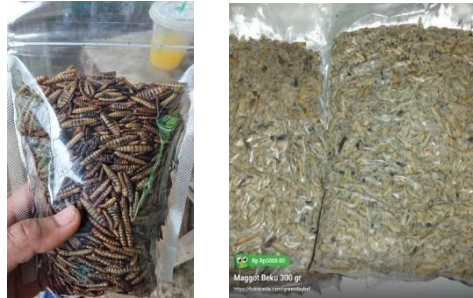
Gambar 2. Maggot Kering dan Basah