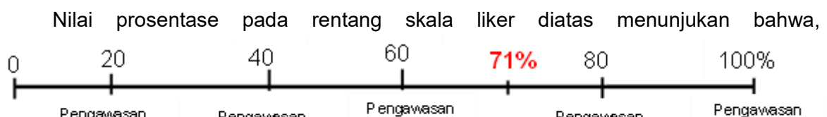
Grafik 4.1. Nilai Prosentase dimensi Variabel Pengawasan Interen

Variabel Pengawasan Interen Anggaran APBD sebagaimana pada grafik1.1 diatas terdiri dari dimensi, Lingkup Pengendalian, dimensi Penilaian Resiko, dimensi Kegiatan Pengendalian Interen, dimensi Informasi Dan Komunikasi, serta dimensi Pemantauan Pengendalian Interen. Ke-5 (lima) dimensi masing-masing indikator, diukur dengan menggunakan 2 (dua) Item pertanyaan kuesioner yang telah dibagikan kepada 20 orang responden yakni, pejabat ASN eselon II (Pimpinan SKPD), Pejabat eselon III, (Sekretaris/Kepala Bidang serta, fungsional perencanaan. Hasil perhitungan nilai total prosentase presepsi responden terhadap variabel Pengawasan Intern sebesar 71%. Jika menggunakan rentang skala likert maka nilai implementasi pelaksanaan SPIP pengawasan Interen berada pada kategori penilaian Kurang Baik . Nilai rentang skala likert 71% berada diantara skor 60% dan 80%. ditampilkan sebagai berikut :