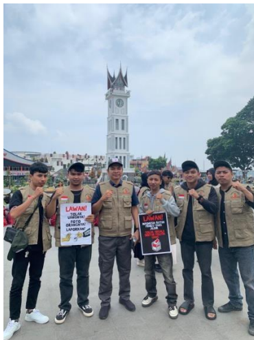
Gambar 3. Aksi Damai “Tolak Politik Uang”

Unjuk rasa juga disebut demonstrasi, adalah sebuah gerakan protes yang dilakukan oleh sekumpulan orang di depan umum untuk menyatakan pendapat kelompok mereka atau menentang kebijakan yang dilakukan oleh suatu pihak (Pratiwi et al., 2016). aksi anti politik dan deklarasi Kawal Pemilu Bersih 2024 oleh Mahasiswa Fakultas Ilmu Hukum Universitas Muhammadiyah Negeri Sumatera Barat dilaksanakan pada tanggal 1 Februari 2024. Aksi ini dimulai dengan long march dari Lokasi Fakultas Universitas Muhammadiyah Sumatera Barat menuju titik kumpul orasi kawal pemilu bersih di pelataran Jam Gadang kota Bukittinggi. Terdapat 4 poin yang akan disampaikan dalam orasi kawal pemilu bersih yaitu :