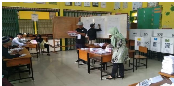
Gambar 4. Pengawasan pelaksanaan pemilu di Kecamatan Mandiangin Koto Selayan

Pengawasan pemilu dapat didefinisikan sebagai proses melihat, meninjau, dan memperoleh laporan serta bukti yang menunjukkan adanya indikasi dugaan awal pemilu. Pengawasan pemilu oleh anggota Kawal Pemilu Bersih dilaksanakan pada 2 TPS di Kecamatan Mandiangin Koto Selayan, yakni TPS 007 di Kelurahan Puhun Tembok dan TPS 003 di Kelurahan Puhun Pintu Kabun. Beberapa prosedur yang digunakan untuk memantau pelaksanaan pemilu adalah: