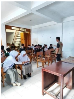
Gambar 1. Kegiatan Sosialisasi Bahaya Politik Uang di Kecamatan Mandiangin Koto Selayan

Dalam proses Sosialisasi Bahaya Politik di Kecamatan Mandiangin Koto Selayan, sosialisasi diberikan kepada masyarakat dan pelajar Sekolah Menengah Atas sebagai pemilih pemula yang belum memiliki pengalaman dalam mengikuti pemilihan umum. Sosialisasi dilaksanakan di SMA N 3 Bukittinggi dan SMA Karya Bhakti dengan topik materi yang disampaikan tentang apa itu politik uang dan bahaya politik uang. Sebelum melaksanakan kegiatan sosialisasi mahasiswa anggota Kawal Pemilu Bersih menanyakan tentang pemahaman dan pendapat masyarakat mengenai politik uang. Peneliti bertanya mengenai persepsi masyarakat terkait kehadiran politik uang ini, NS selaku salah satu warga menanggapi bahwa politik uang tidak sepenuhnya berdampak negatif bagi masyarakat. Ia menjelaskan bahwa: