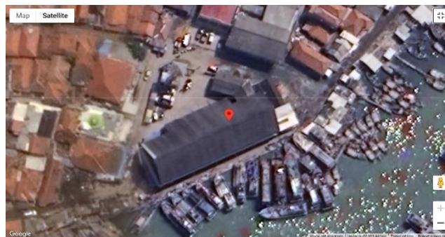
Gambar 1. Lokasi Pelabuhan Perikanan Pantai Eretan

Pelabuhan Perikanan Pantai (PPP) Eretan berada di muara Sungai Eretan, Jalan KUD Misaya Mina Desa Eretan, Kecamatan Kandanghaur, Kabupaten Indramayu, Provinsi Jawa Barat. Pelabuhan tersebut dibangun pada tahun 1926 yang terdiri dari dua wilayah, yaitu Eretan Wetan dan Eretan Kulon. Aset pelabuhan dimiliki oleh Pemerintah Daerah (Pemda) Provinsi Jawa Barat tetapi pelabuhan tersebut dikelola oleh KUD Mina Bahari (Kulon) dan KUD Misaya Mina (Wetan).