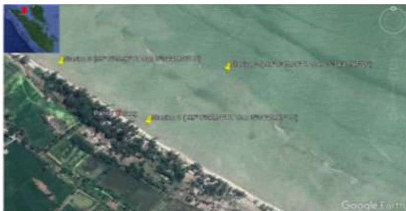
Gambar 2. Peta Lokasi Penelitian

Stasiun Penelitian ditentukan berdasarkan titik koodinat yang diambil dengan menggunakan Global Potitioning System (GPS). Ada 3 Stasiun Pengamatan pada penelitian ini, yakni : Stasiun 1, Satsiun 2 , dan Stasiun 3. Stasiun Pengamatan tersebut ditentukan berdasarkan informasi kunci dari nelayan yang biasa menangkap kerang tembarang. Peta lokasi penelitian dapat dilihat pada gambar 2.