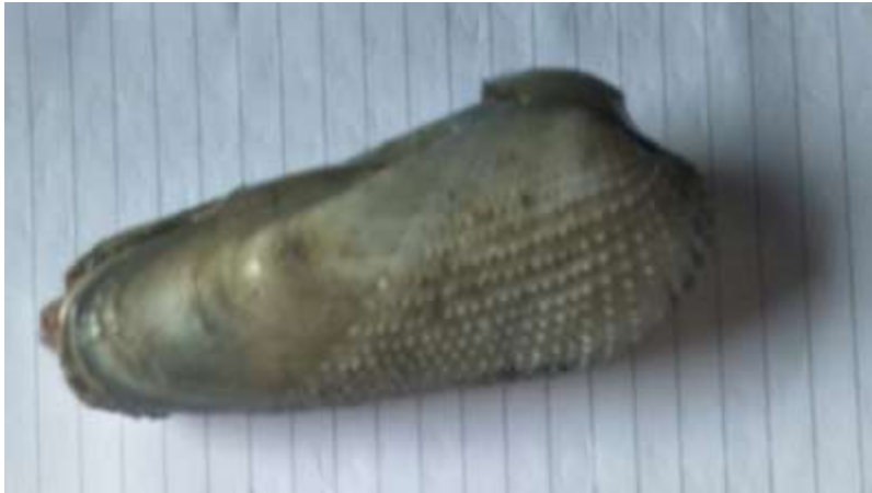
Gambar 1. Kerang Tembarang

Pantai Kelang merupakan salah satu habitat Kerang Tembarang ( Pholas orientalis Gmelin, 1791). Kerang ini masuk ke dalam kelompok kerang pengebor ( razor clam ). Masyarakat sekitar biasa menyebutnya sebagai kerang tembarang, kerang bintangang, kerang, keris, dan kerang aceh. Namun secara umum lebih dikenal sebagai kerang tembarang. Hasil tangkapan kerang tembarang biasa dijual nelayan dengan harga Rp 10.000 - 15.000/ kg (Hasil Wawancara Pribadi, 2019).