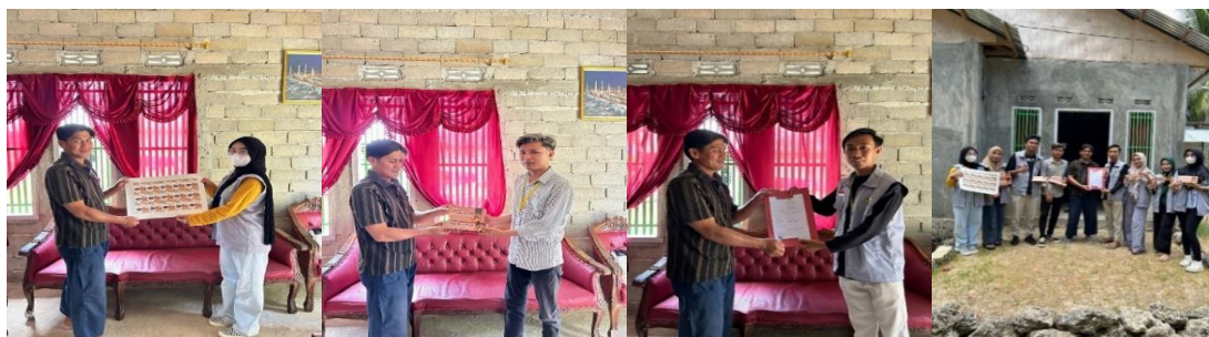
Gambar 6: Penyerahan stiker, kemasan, sertifikat halal produk pada pelaku UMKM kue pia barokah.

Pada tahap pelaksanaan kegiatan ini mahasiswa melakukan penyerahan desain brand dan desain kemasan kepada pelaku usaha kue pia barokah. Selain itu mahasiswa juga menyerahkan sertifikat halal produk yang sebelumnya sudah disarankan oleh mahasiswa untuk memudahkan pelaku usaha kue pia barokah tersebut dalam memperluas pemasaran produknya karena terjamin aman untuk dikonsumsi dan halal serta menjelaskan cara promosi produk menggunakan sosial media. dan mahasiswa juga menjelaskan bagaimana cara promosi yang baik dan benar agar dapat menarik perhatian para konsumen.