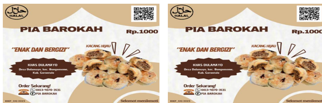
Gambar 4: Stiker bahan quantac gloss

Selain desain kemasan, mahasiswa juga membuat desain stiker pada tanggal 19-23 Agustus 2023 untuk ditempel pada kemasan kue pia tersebut. Sebelum dicetak mahasiswa memperlihatkan desain stiker dan kemasan tersebut kepada pelaku UMKM kue pia dan beliau sangat suka dengan desain tersebut. Dengan desain stiker bahan quantac gloss harga Rp. 18.500/lembar A3 sesuai ukuran.