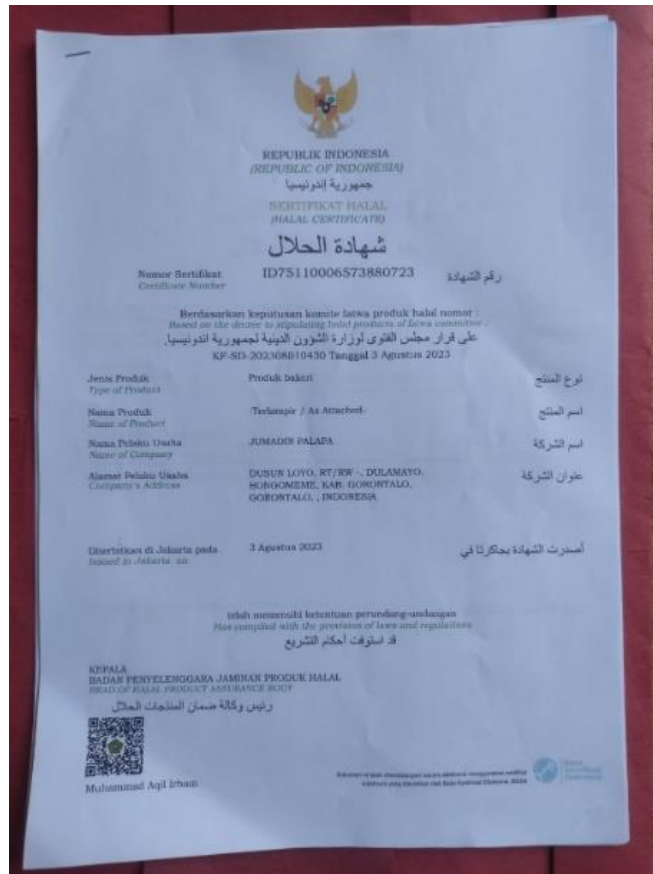
Gambar 5: Sertifikat halal