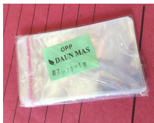
Gambar 2: Kemasan duplex dus uk 25x5x5 Gambar 3: Kemasan plastik uk 7x10 Kemasan duplex dus uk 20x10x5

Selain desain kemasan, mahasiswa juga membuat desain stiker pada tanggal 19-23 Agustus 2023 untuk ditempel pada kemasan kue pia tersebut. Sebelum dicetak mahasiswa memperlihatkan desain stiker dan kemasan tersebut kepada pelaku UMKM kue pia dan beliau sangat suka dengan desain tersebut. Dengan desain stiker bahan quantac gloss harga Rp. 18.500/lembar A3 sesuai ukuran.