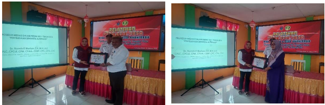
Gambar 4. pemberian penghargaan kepada kedua Desa (Deme Dua dan Bubalango)

Mentoring oleh pengacara atau praktisi hukum yang lebih berpengalaman merupakan bentuk pembinaan lainnya. Para mentor dapat membimbing paralegal dalam kasus-kasus sulit serta memberikan masukan untuk meningkatkan profesionalisme dan pengambilan keputusan yang berintegritas. Menurut Rahman (2018), "Mentoring yang baik dapat mempercepat peningkatan kapasitas dan profesionalisme paralegal." Penghargaan terhadap kinerja yang baik juga dapat menjadi motivasi penting bagi paralegal. Program penghargaan dapat mencakup sertifikat penghargaan, pengakuan publik, atau dukungan untuk mengikuti pelatihan lebih lanjut. Ini mendorong perilaku positif dan meningkatkan motivasi untuk tetap menjaga integritas. Menurut Dewi (2021), "Pengakuan atas prestasi paralegal memotivasi mereka untuk terus meningkatkan kualitas pelayanan hukum."