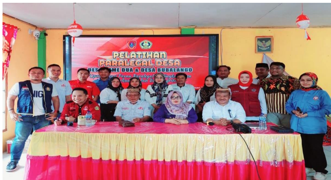
Gambar 3. Foto bersama para pemateri dan para peserta pelatihan

Kode etik paralegal harus menjadi pedoman utama dalam menjaga integritas mereka. Kode etik ini memuat prinsip-prinsip profesionalisme, kerahasiaan, dan larangan menerima gratifikasi atau melakukan tindakan yang dapat merugikan masyarakat. Kepatuhan terhadap kode etik harus diawasi oleh komite disipliner. Menurut Aminah, Siti dan Muhamad Daerobi (2019) 8 , "Pelanggaran kode etik adalah ancaman serius bagi reputasi dan kepercayaan terhadap paralegal."