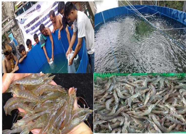
Gambar 4. Kegiatan produksi udang vannamei di kolam terpal bundar

Indikator persentase keterampilan dalam melakukan budidaya udang vannamei dapat dilihat pada gambar 5 sebagai berikut.