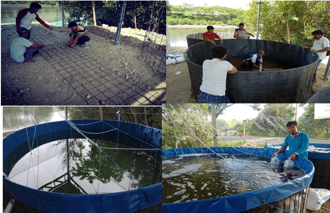
Gambar 3. Konstruksi sarana produksi udang vannamei dengan menggunakan kolam terpal bundar