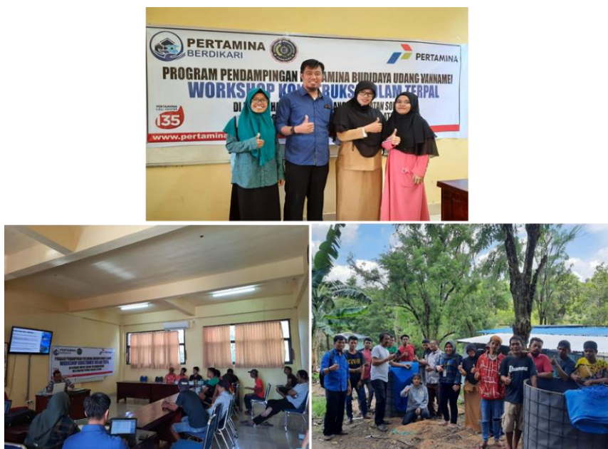
Gambar 1. Suasana penyuluhan/workshop budidaya udang vannamei

Hasil evaluasi keterampilan peserta dalam melakukan proses produksi udang vannamei menunjukkan peningkatan yang tinggi. Tingkat keterampilan peserta berdasarkan indikator 80 – 100% dari tidak bisa menjadi terampil melakukan budidaya udang vannamei. Hasil akumulasi keterampilan peserta, secara akumulatif disajikan pada gambar 5. Tingkat keterampilan peserta belum merata, namun secara kelompok telah berhasil memproduksi udang vannamei.