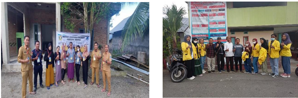
Gambar 1. Survey Lokasi