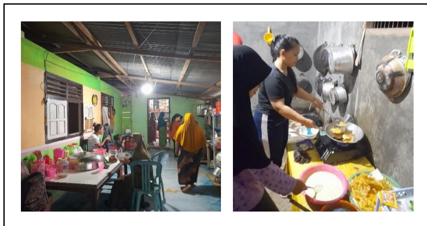
Gambar 2. Proses pembuatan produk rempeyek kacang hijau

Pelaksanaan kegiatan produksi rempeyek kacang hijau ini dilaksanakan selama 1 hari yakni pada hari senin, 25 Juli 2022. Kegiatan pelatihan dilakukan dengan pemaparan bahan dan cara pembuatan rempeyek kacang hijau (Gambar.2).