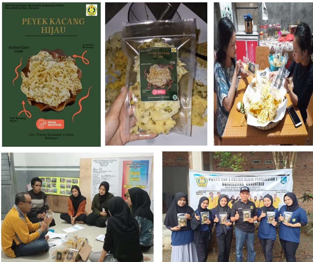
Gambar 3. Pengemasan produk rempeyek kacang hijau dan bimbingan oleh Dosen Pembimbing Lapangan

Tahapan selanjutnya adalah bagaimana mengemas produk yang telah dihasilkan agar tahan lama dan dapat dipasarkan dengan baik. Pada tahap ini, peserta kegiatan belajar mengemas produk dalam kemasan menggunakan cara sederhana maupun dengan peralatan pengemasan yang lebih modern. Pengemasan menggunakan peralatan yang modern, menjamin ketahanan produk dalam waktu yang lama dan tidak mudah rusak. Hal ini berkaitan dengan jangka waktu kadaluarsa dari produk rempeyek kacang hijau yang dipasarkan. Pada tahap ini peserta tidak mengalami kesulitan dalam mempraktekkan cara pengemasan produk seperti pada (Gambar 3).