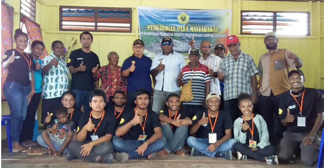
Gambar 1. Kegiatan Sosialisasi Pendampingan Pembuatan Website Kampung di Kantor Kampung Enggros