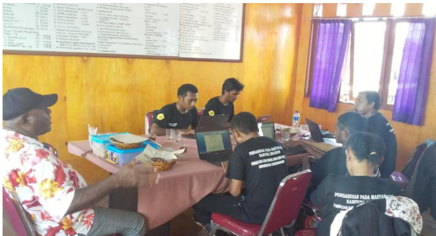
Gambar 2. Suasana Pelatihan Dasar Website kepada Pemuda dan Aparat Kampung

Kegiatan pelatihan dasar tersebut, berhasil dilaksanakan sebanyak 4 kali pertemuan, bertempat diruang kerja Kantor Kampung Enggros dimulai pukul 11.00 – 15.00 WIT tiap Hari Sabtu.