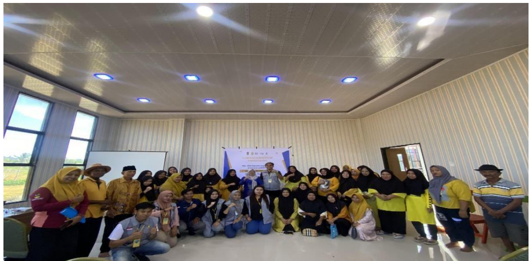
Gambar 1. Tahap Pertama Sosialisasi Pelatihan Digital Marketing Dan Pemberdayaan UMKM Desa Katialada

Adapun tahapan-tahapan dari sosialisasi serta proses pembuatan produk dan akun media social adalah sebagai berikut: