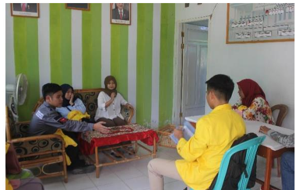
Gambar 1: Survei Lokasi