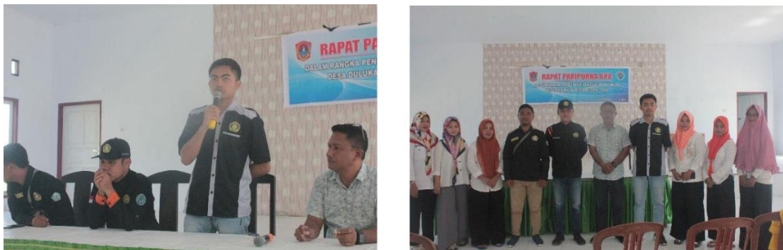
Gambar 2: Sosialisasi

Pada sosialisasi juga masyarakat mendapatkan pengetahuan tentang biopori mampu meningkatkan daya penyerapan tanah terhadap air sehingga risiko terjadinya penggenangan air (waterlogging) semakin kecil. Air yang tersimpan ini dapat menjaga kelembaban tanah bahkan di musim kemarau. Keunggulan ini dipercaya bermanfaat sebagai pencegah banjir. Sosialisasi untuk pembuatan biopori sebagai tempat sampah organik pada masing-masing rumah tinggal. Sosialisasi disertai dengan memberi contoh alat biopori dan paparan praktek pembuatan biopori. Sementara untuk lokasi pembuatan lubang biopori dan bagaimana menjaga lubang resapan selalu penuh teriisi sampah organik.