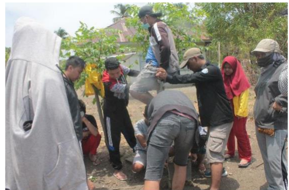
Gambar 4: Proses Pembuatan Biopori